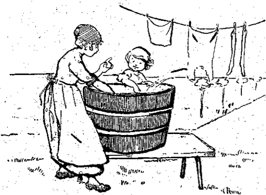
«Θέλει νὰ πιάσῃ τὸ νερό...» (Σελ. 356, στ. α΄.)

πουνίζει ρούχα μ' ἐκεῖνο τὸ νερό, καὶ ἡ Λουλούκα πηγαίνει καὶ στέκεται κοντὰ της, καὶ τὴν κυττάζει πῶς σαπουνίζει.