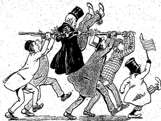
«Τὸν ἐσήκωσαν καὶ τὸν ἐπῆγαν ἐν θριάμβῳ...» (Σελ. 356, στ. γ΄.)

Ἀλλὰ ὁ θυρωρὸς, ὄλος ἀφιερωμένος εἰς τὴν ἰδέαν ποῦ τοῦ κατέθε, δὲν ἤκουε. Ἐζύμωμεν μέσα στὰ χεῖρα του τὸ χρυσοκενημένο του κασκέττο, καὶ κατασυγχυσμένος, ἐτραβοῦσε καιρικῶτα τὰ